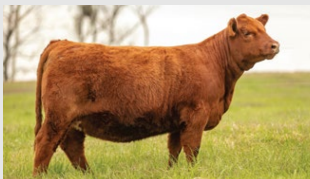
R.P. 4482 MODELO RUBETA /4482 RED TE