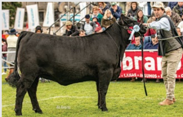
R.P. 3738 MODELO BIENHECHO/3738 TE