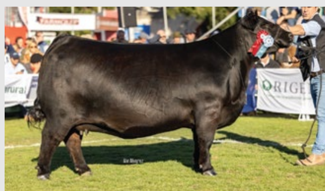
HERMANA ENTERA DE ESTA COMBINACIÓN, CAMPEONA VACA PRADO 2025